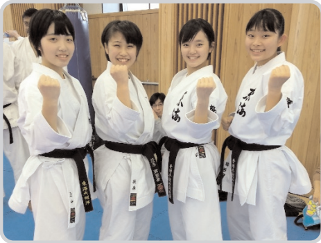
Die nächste Generation schon ganz weit vorne am Start